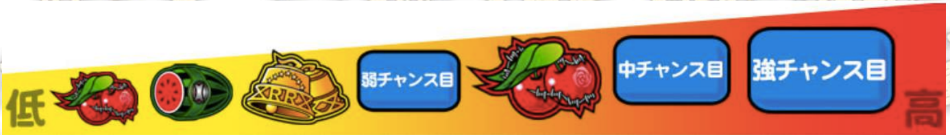
弱櫻桃 西瓜 鈴鐺 弱機會項目 強櫻桃 中機會項目 強機會項目