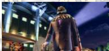
職業摔角會場(夜)舞台