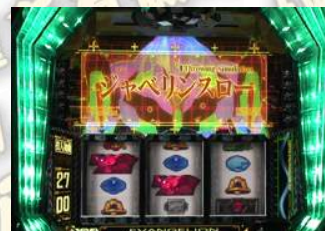
シャベリンスロー