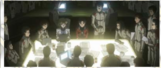
作戰會議出席者予告