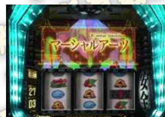
マーシャルアーツ