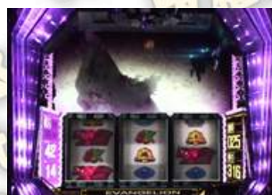
SUPER BIG BONUS