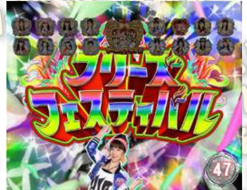
AKB フリーズフェスティバル(凍結祭典)

フリーズフェスティバル(凍結祭典)中是48圖案連線為全雙線，成立時的1/2為MUSIC凍結發生。