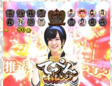
Team SURPRISE COMBO SKE48 下克上チャンス NMB48 てっぺんチャレンジ