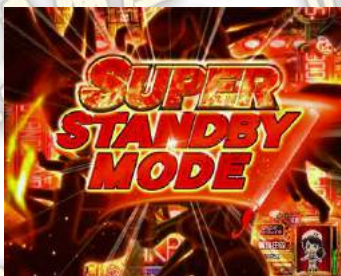
SUPER STANDBY MODE