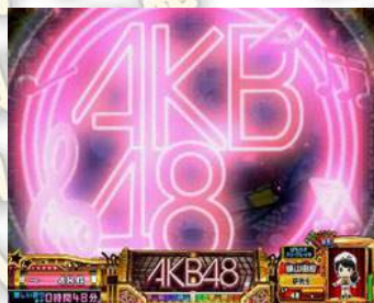
AKB48 LOGO ATTACK