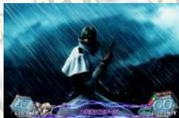
< 阿道夫舞台 (通常)