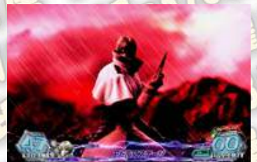
< 阿道夫舞台 高 (紅背景)