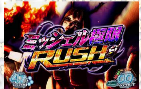
ミッシェル(蜜雪兒)極限 RUSH