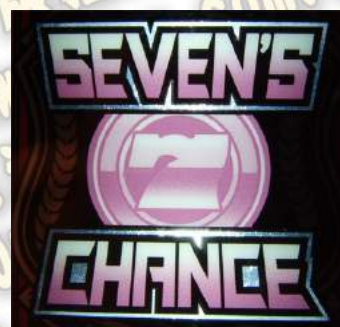
SEVEN' S CHANCE