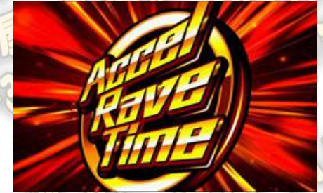
Accel Rave Time(集中)

Accel Rave Time(集中)中是可以選擇樂曲，也有COMBO繼續數到達，被解放的樂曲。