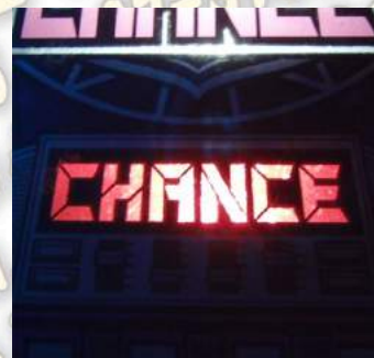
SEVEN' S GAME

時，也是BONUS or Accel Rave Time(集中)期待度大幅增加。