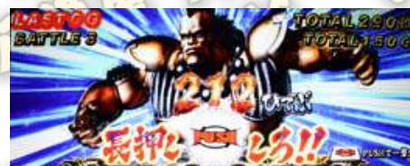
シャチ(鯨)-鬪神演舞中