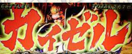
シャチ(鯨)-神拳勝舞中