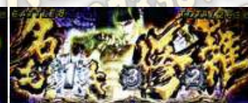
ケンシロウ(拳四郎)-神拳勝舞中