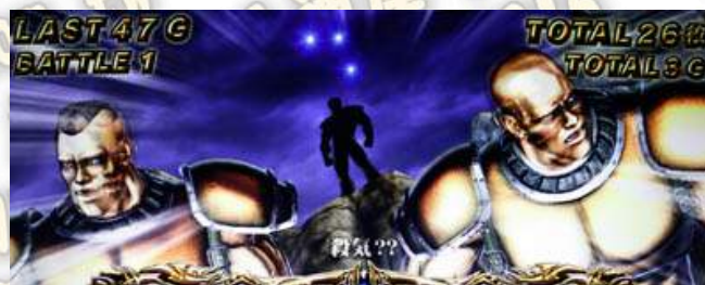
ケンシロウ(拳四郎)-闘神演舞中