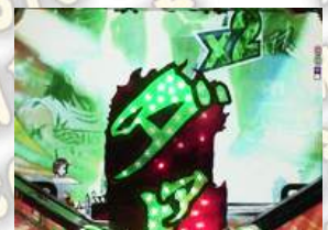
闘魂フィスト予告