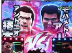
戰決定一世界技闘格