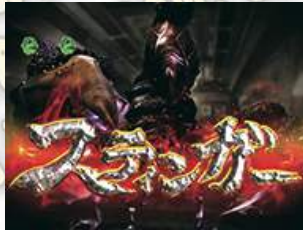
高潮聽牌 (戰鬥系聽牌後半)

3種類的戰鬥系聽牌的後半，經由電影預告為信賴度提高。請注意切入的種類，紅色和瓢蟲圖樣為大當將至。