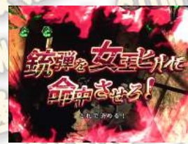
DEAD or ALIVE聽牌

經由電影預告和任務系聽牌等發展的刺激聽牌，從 DEAD or ALIVE 的顯示發展。試作型暴君與女王蛭第 1 形態的 2 種類存在，比利和蕾貝卡進行合作打敗敵人為大當。請注意標題的顏色，金色為信賴度驟漲。