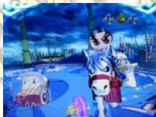
馬 / 老鷹聽牌

存在 3 種種類，BATTLE 勝利則大當口信賴度依照「大膽不敵 雷夢」<「疾風迅雷 御庭番」<「夕陽交鎖戰」的順序提升。